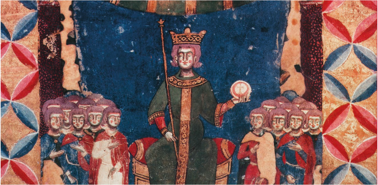
Salerno, Biblioteca Diocesana, Exultet, fol. 11, miniatura con re in trono, identificabile con Federico II.

F ederico, per grazia di Dio imperatore dei Romani sempre augustus e re di Sicilia, agli arcivescovi, vescovi e altri prelati delle chiese, ai marchesi, conti, baroni, giustizieri, camerari, giudici, balivi e a tutti i fedeli del Regno di Sicilia che leggono la presente lettera.