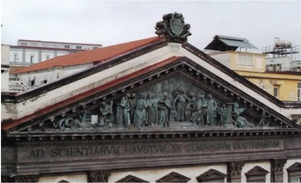
Figura 6. Francesco Jerace (1910): Iscrizione del frontone della sede centrale dell'Ateneo: «Ad scientiarum haustum et seminarium doctrinarum».

«Ad scientiarum haustum et seminarium doctrinarum»