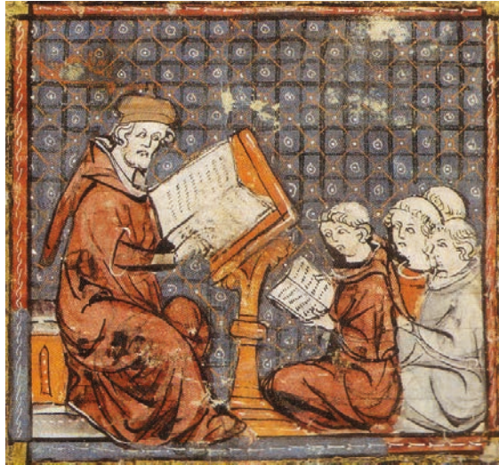
Castres, Bibliothèque municipale, ms. 3: Grandes Chroniques de France, fol. 277r.