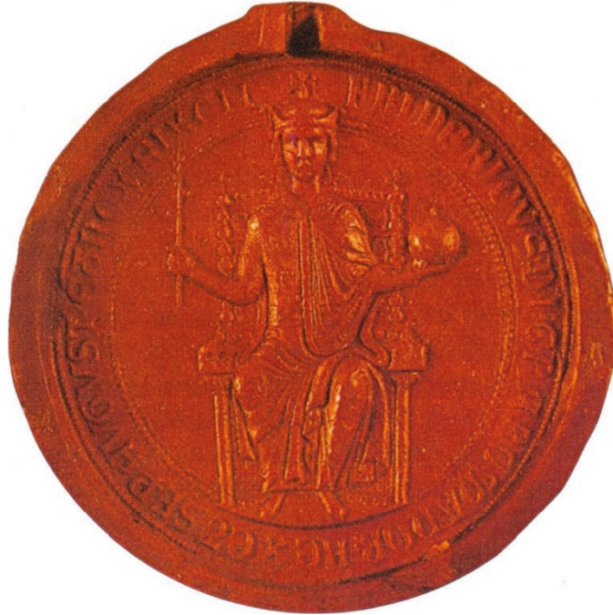
Il simbolo dell'Università corrisponde esattamente al sigillo usato dall'imperatore Federico II negli anni della fondazione del 1224.

F edericus Dei gratia Romanorum imperator semper augustus et Sicilie rex, archiepiscopis, episcopis et aliis ecclesiarum prelati, marchionibus, comitibus, baronibus, iustitiariis, camerariis, comestabulis, baiulis, iudicibus et universis per regnum Sicilie constitutis fidelibus suis presentes litteras inspecturis gratiam suam et bonam voluntatem.