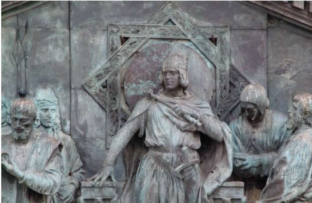
Francesco Jerace (1910): Federico II dà ordine di istituire l'Università. Frontone della sede centrale dell'Ateneo.

« A d scientiarum haustum et seminarium doctrinarum», ovvero «alla fonte delle scienze e al vivaio dei saperi»: è questa l'iscrizione che campeggia sul portone d'ingresso della sede principale dell'Università di Napoli, che dal 1992 è intitolata al suo fondatore, l'imperatore Federico II di Svevia. Non si tratta solo di un motto suggestivo o retoricamente evocativo: è identificativo, perché racchiude in sé la memoria di otto secoli di storia. Nel 1224, proprio con quelle parole, l'imperatore Federico iniziava una lettera circolare (o manifesto ) indirizzato all'impero e al mondo intero per annunciare l'istituzione dell'Università di Napoli: «in regnum nostrum desideramus multos prudentes et providos