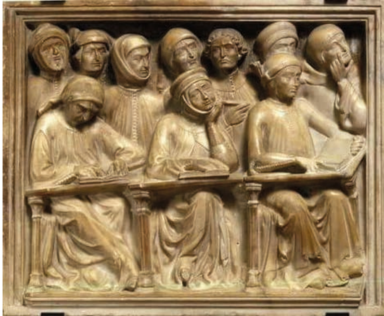
Studenti raffigurati in un frammento dell'arca di Giovanni da Legnano. Opera di Pierpaolo dalle Masegne, 1383, Bologna, Museo medievale.